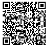
〈感染防止宣言ステッカー (サンプル)〉

みせ 店に いく 行くときは おおさかふ 大阪府の しるし (右) がある お店を えら 選ぶ