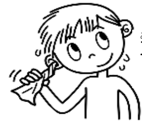
耳に水が入ったら 水ぬきをする