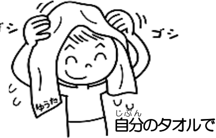
自分のタオルでよくふく