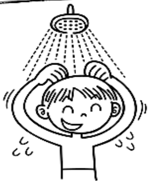
シャワーをあびる

プールの水にはバイキンがふえないように薬を入れています。プールから出るときは、体についたその薬を、しっかり流すようにしましょう。