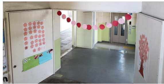
3年生の階段踊り場に飾られた2年生からのメッ