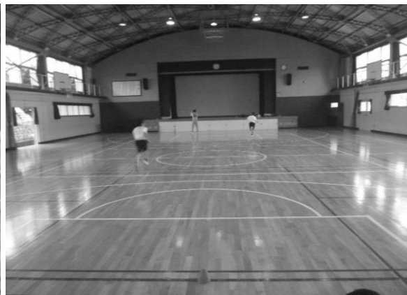
ねん だんし たいいく 1年男子体育 たいりよそくてい 体力測定 シャトルランに挑戦！ ちようせん 100を超える1年生も！ こ ねんせい すごい！