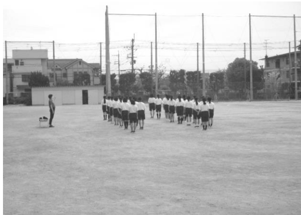
ねんじょし たいいく 1年女子体育 にれつ おうたい 二列横隊から よんれつじゅうたい せいいついでう 四列縦隊への せいれついどう 整列移動！ もく (R4・4・21：木)