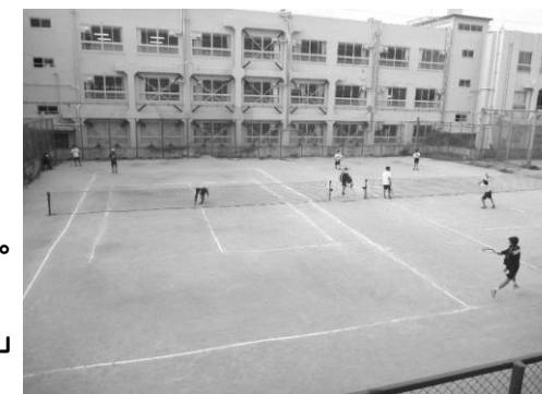
テニス部の練習の様子（5月10日：火）