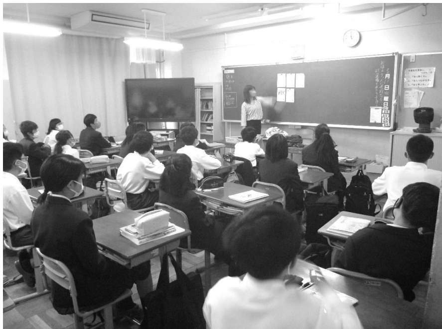
国語2の授業の様子！