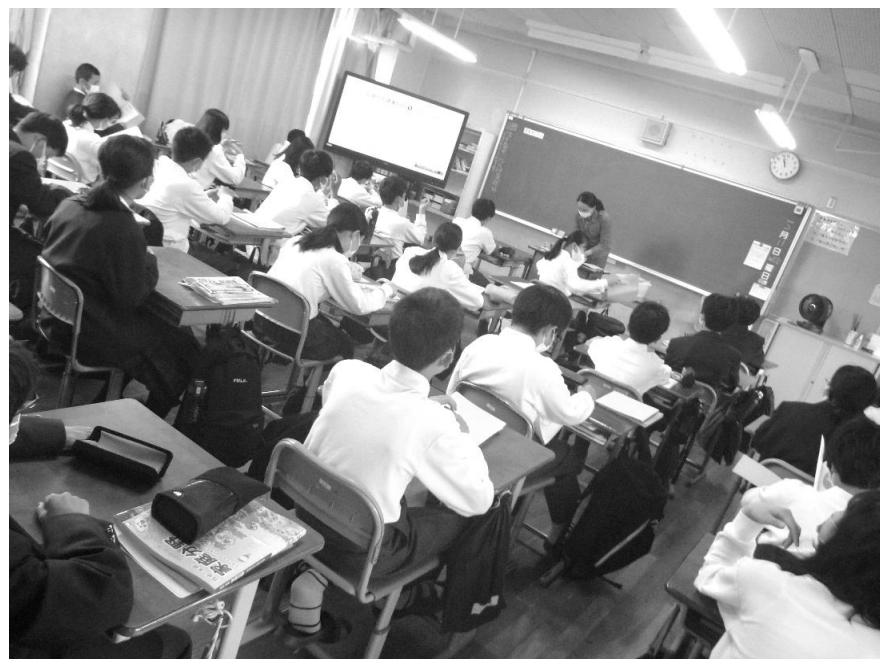
家庭科の授業の様子！