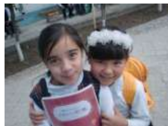
ウズベキスタンの子どもたち

今を精一杯楽しむために、一つ一つの選択を自分で考え、自分で決めることが大切です。今、勉強するのか友だちと遊ぶのか、どのクラブに入るのか、どの高校に進学したいのか。自分の人生を精一杯楽しみ、今を一つ一つ積み重ね将来につなげてください。