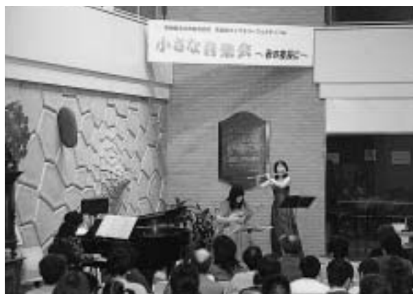
ライブラリーフェスティバル