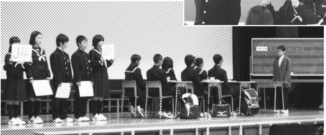
J4を「劇」で説明する2年学級委員